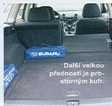
Další velkou předností je prostorný kufr.

Subaru Outback se v základní verzi Trend prodává za cenu bezmála devíti set tisíc korun. V ní je zahrnuta výbava, kterou bychom