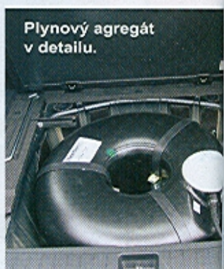
Plynový agregát v detailu.